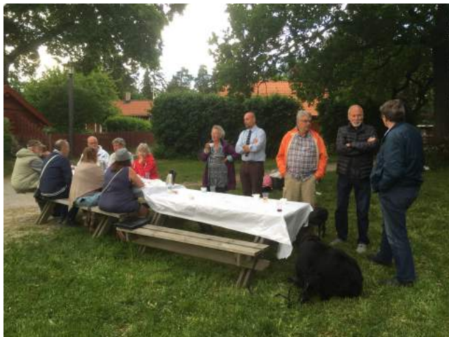
Styrelsemöte i Akalla by under sommarperioden.