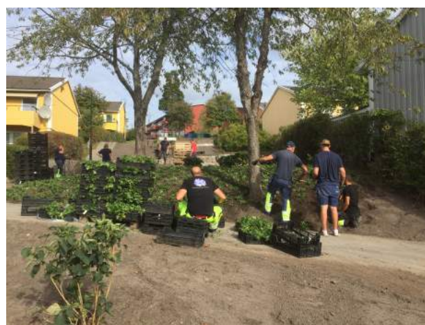
Sedan kom det här gänget...