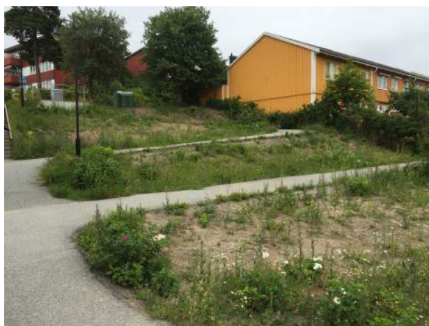
Så här såg det ut...

I början av sommaren var man på plats med en grävsropa och tog bort alla buskar. Sedan hände inte någonting. Många började undra om det skulle växa upp nytt ogräs. MEN – äntligen kom det slutet av sommaren, ett gäng duktiga trädgårdsarkitekter, som nu har planterat nya buskar och lagt stenpartier. Det har verkligen blivit jättefint och vi får hoppas att kommunen nu underhåller vår slingerbult. Vi undrar bara vad som är tänkt längst ner vid sopbehållarna, där det växer fritt just nu. På hemsidan kan man se mer om vad som är planerat, och hur det är tänkt att bli med växter, buskar etc.