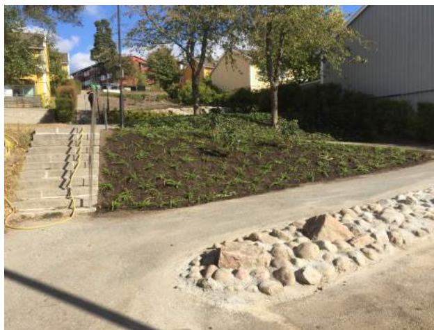
och planterade det här. Och nu är det så här fint!